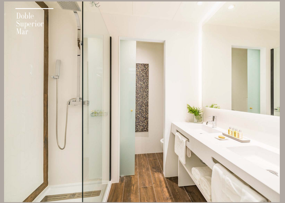
Doble Superior Mar