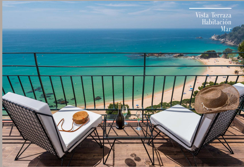
Vista Terraza Habitación Mar